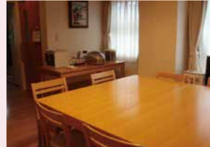
長崎いずみの郷サロン